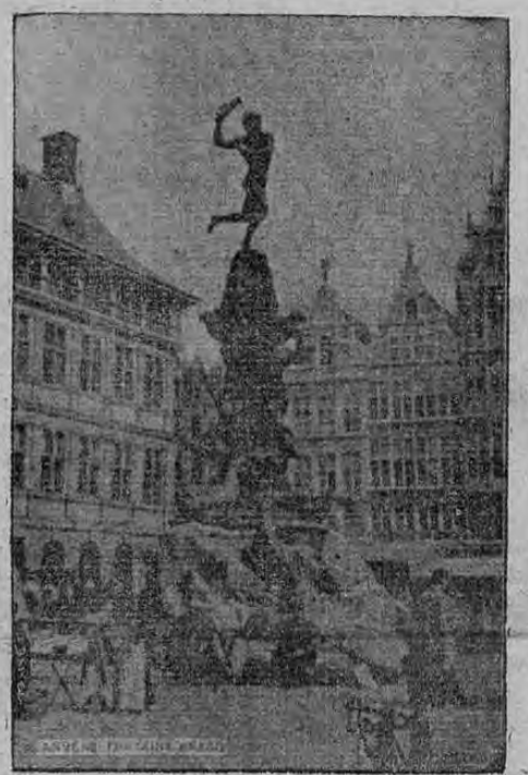
La notable Fuente Brabo, una de las más nobles y artísticas de la hermosa ciudad de Amberes.