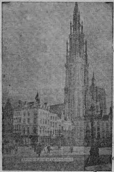
Preciosa flecha de la magnífica catedral gótica de Amberes, que contiene notabilísimos cuadros de Rubens e infinidad de objetos de arte de gran valor.